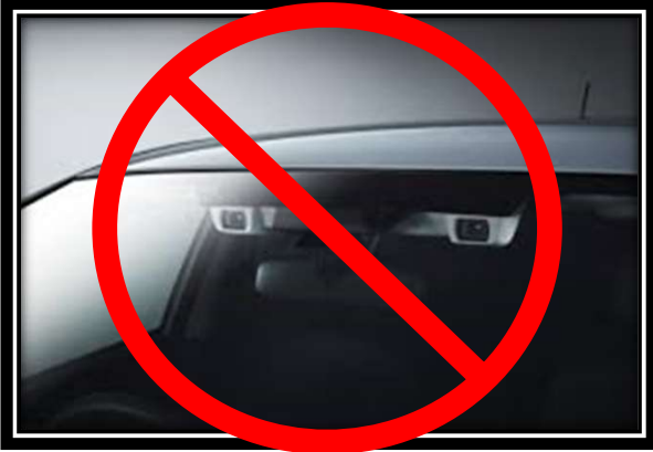
※1. 自動(衝突被害軽減)ブレーキ装着車