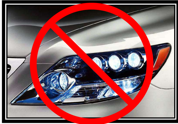
※4. 純正ライトからLEDに付け替えている車両